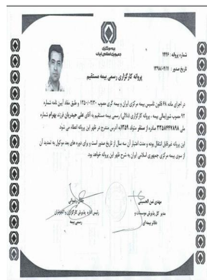
پروانه بهره برداری کارگزاری بیمه ۱۴۴۶