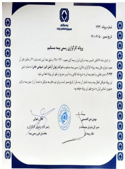
پروانه بهره برداری شرکت کارگزاری بیمه ژویان آرامش البرز ۱۷۷۴